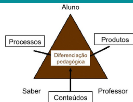
Fig. 1 Articulação entre os dispositivos de diferenciação (adaptado de Przesmycki, 1991)

Um modelo da diferenciação pedagógica como resposta à ação educativa para as diferentes necessidades dos alunos.